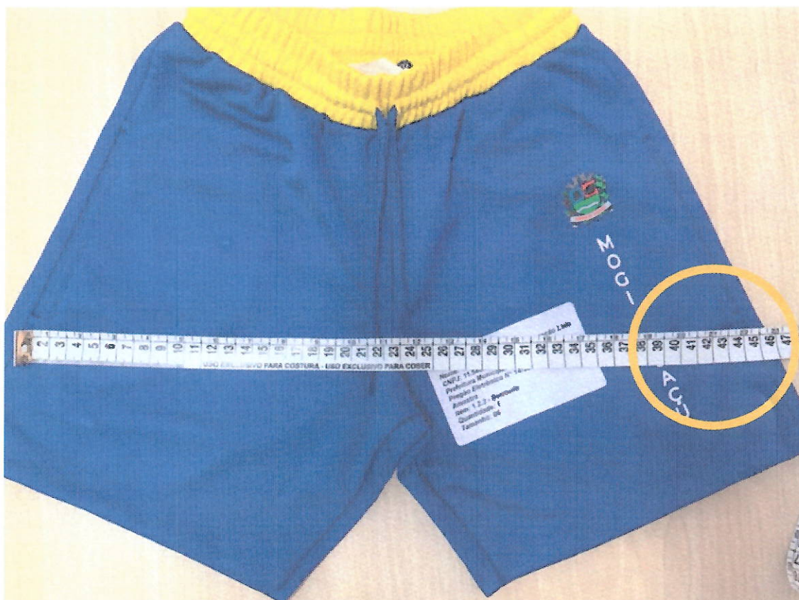
AMOSTRA DO LICITANTE