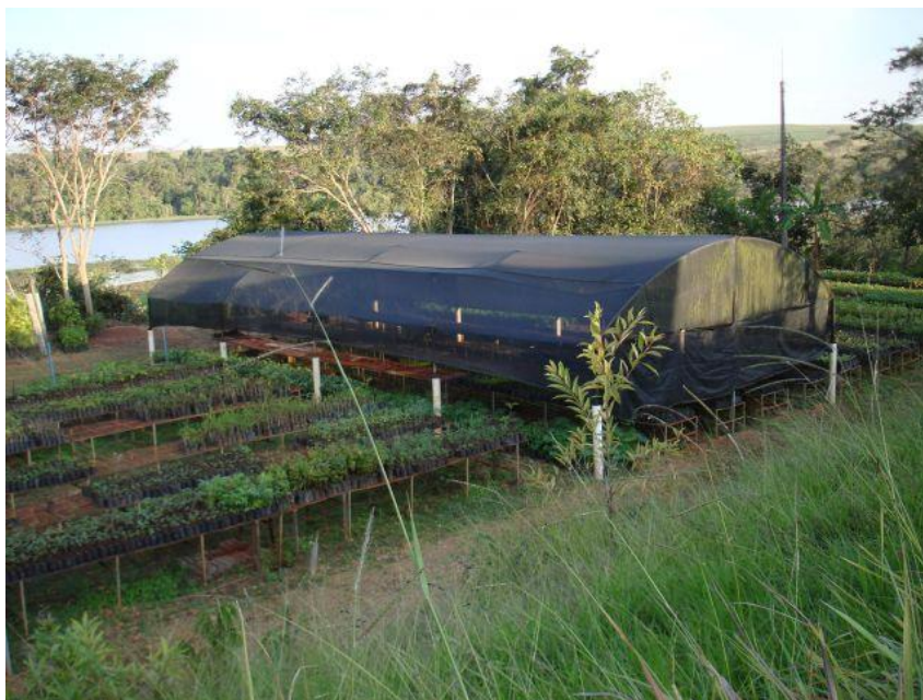
Fig. 4: Vista da estufa de sombrite

Telefones: (19) 3851-7030/7031 - Site: www.mogiguacu.sp.gov.br