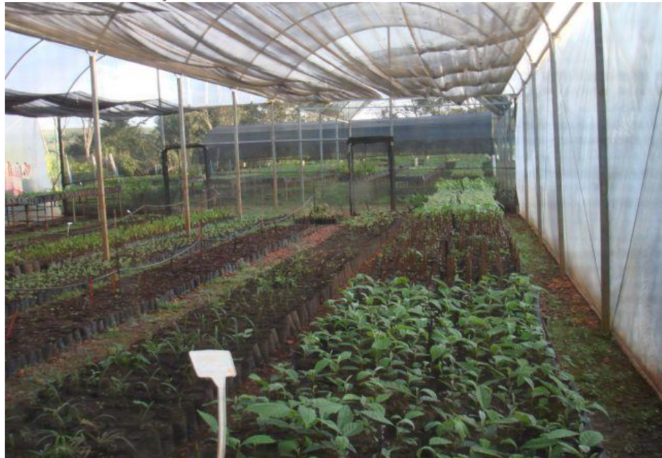
Fig. 1: Estufa de crescimento

As fotos 1,2,3 e 4 ilustram as instalações existentes no viveiro.