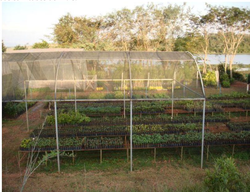
Fig. 3: Área de rustificação das mudas