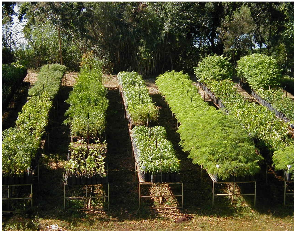
Fig.2: Vista das mudas

Telefones: (19) 3851-7030/7031 - Site: www.mogiguacu.sp.gov.br