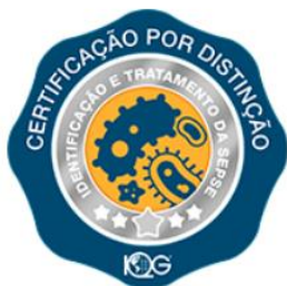
Prevenção de Sepse

A certificação Segurança do Paciente, tem por objetivo incentivar a adoção de boas práticas, por meio da implementação de processos eficazes para prevenção, detecção e resposta a incidentes e resposta a incidentes e eventos adversos.