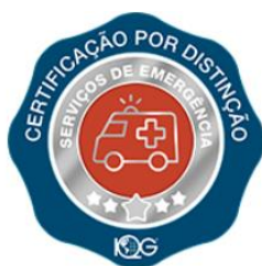
Serviços de Urgência e Emergência

• O programa de certificação por distinção da identificação precoce e tratamento da sepse desenvolvido em parceria com o Instituto Latino Americano de Sepse – ILAS, incentiva as instituições de saúde a trabalhar não só a identificação precoce da sepse, mas também instrumentaliza o grupo de gestores e profissionais atuantes da organização a realizar uma análise qualitativa dos dados disponíveis, identificando uma série de oportunidades, assim como auxilia na implantação de barreiras.