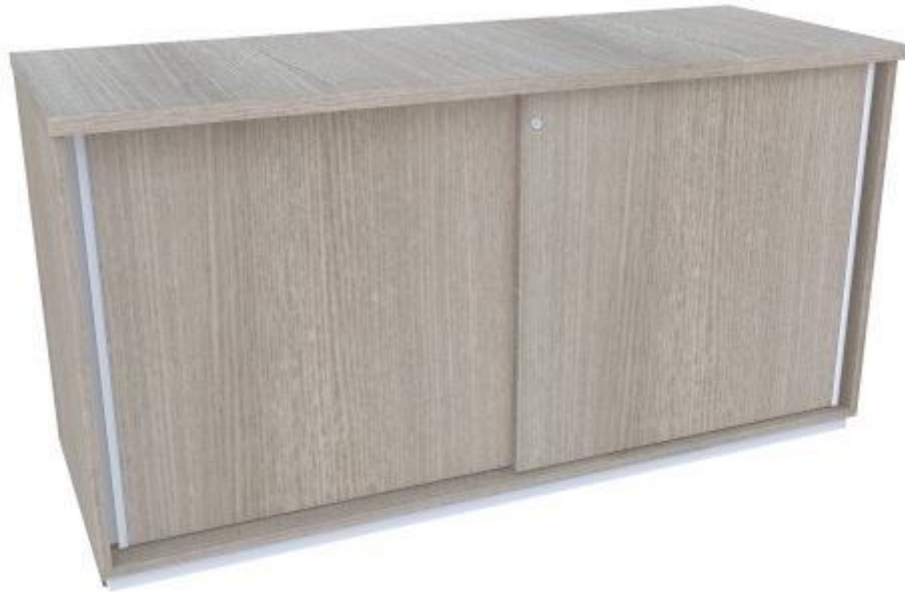
Figura 4 - ITENS: 1.1.4 e 1.1.5

PAÇO MUNICIPAL - Rua Henrique Coppi, 200 - Loteamento Moro do Ouro - Mogi Guaçu/SP - CEP: 13840-904 Telefones: (19) 3851-7030/7031 - Site: www.mogiguacu.sp.gov.br