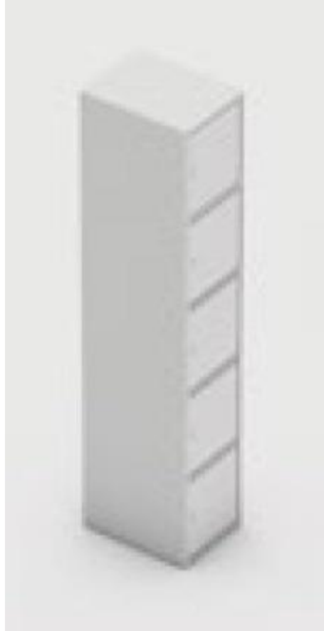
Figura 1 - ITEM 1.1.1