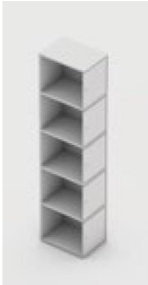
Figura 2 - ITEM 1.1.2

PAÇO MUNICIPAL - Rua Henrique Coppi, 200 - Loteamento Moro do Ouro - Mogi Guaçu/SP - CEP: 13840-904 Telefones: (19) 3851-7030/7031 - Site: www.mogiguacu.sp.gov.br