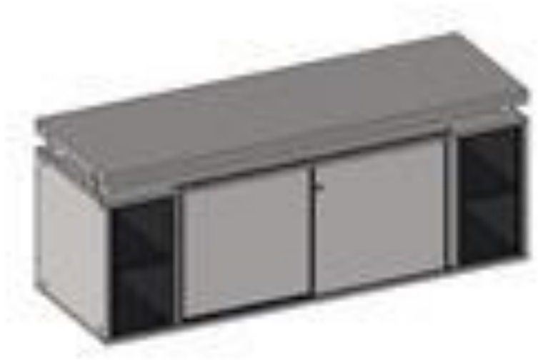
Figura 5 - ITEM 1.1.6

PAÇO MUNICIPAL - Rua Henrique Coppi, 200 - Loteamento Moro do Ouro - Mogi Guaçu/SP - CEP: 13840-904 Telefones: (19) 3851-7030/7031 - Site: www.mogiguacu.sp.gov.br