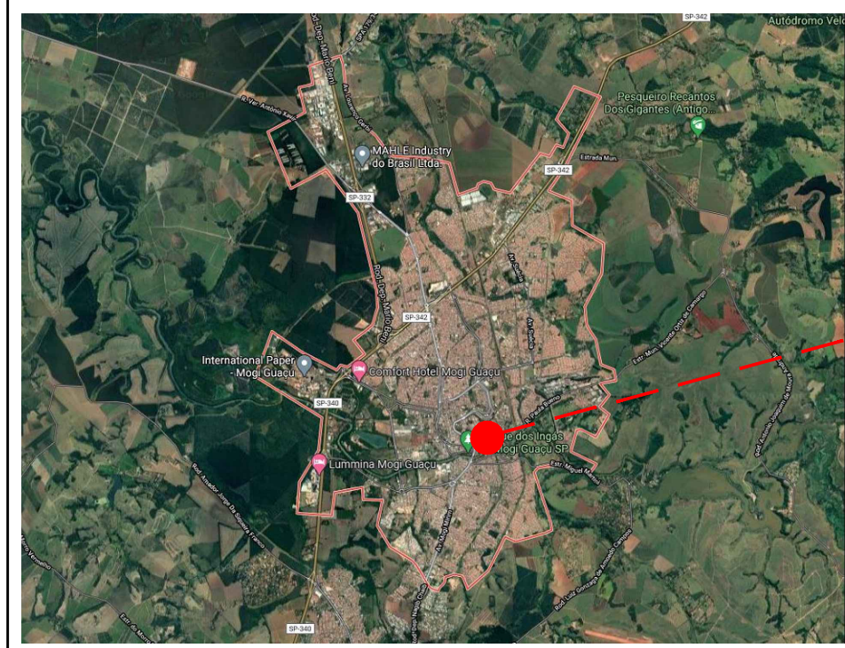
MAPA DE LOCALIZAÇÃO SEM ESCALA