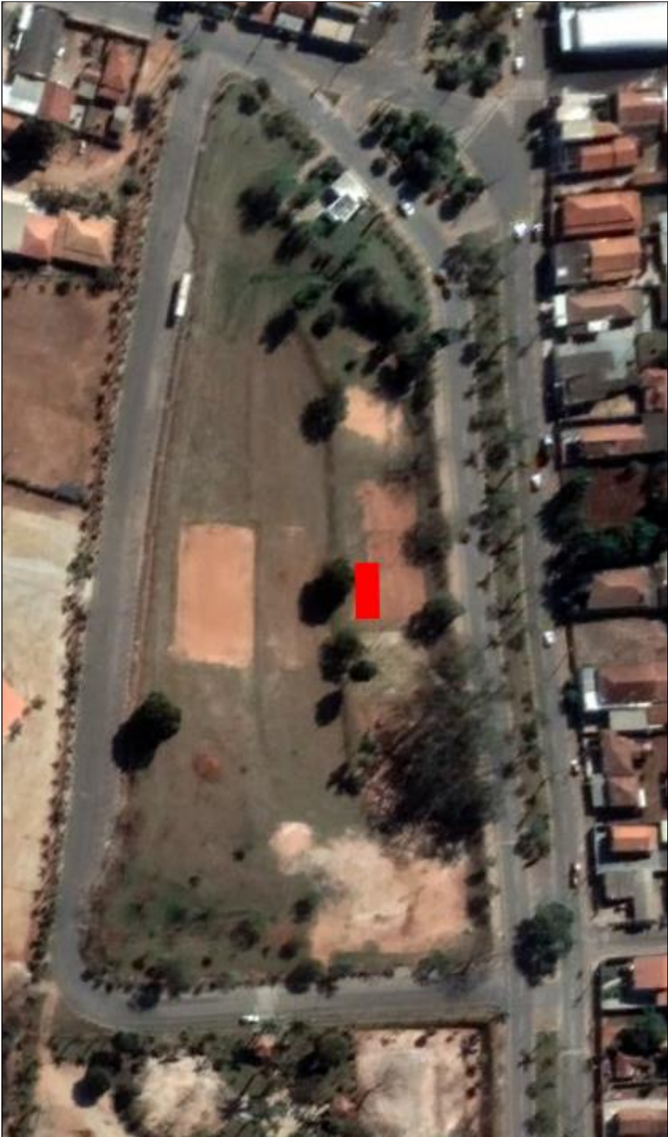
PRAÇA GONÇALO FERNANDES DE LIMA - MARTINHO PRADO/SP SEM ESCALA PARTE 01